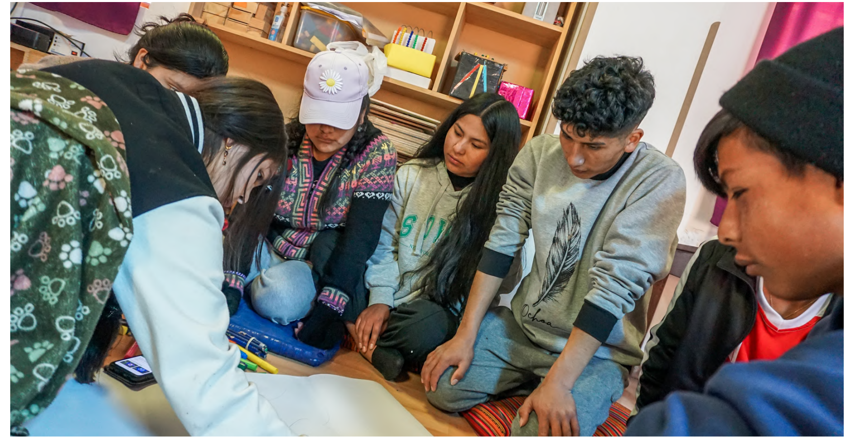
Todos los talleres de la Fase 1 son participativos e involucran trabajo individual y en equipo.