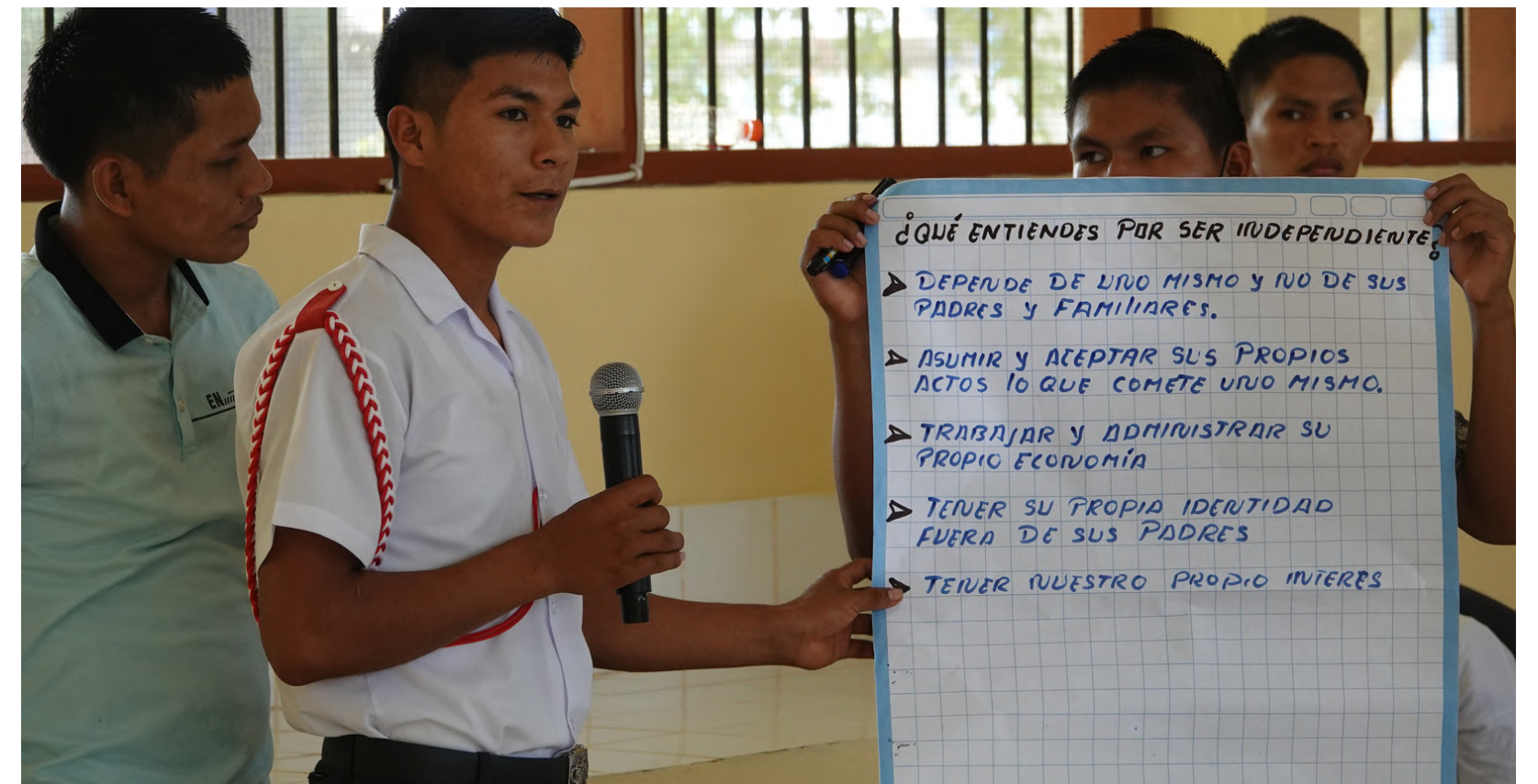
Los talleres brindados en Plan de Vida requieren de la participación activa de todos/as los/as jóvenes, ya sea de forma individual o grupal, de modo que pueden desarrollar habilidades blandas a la vez que obtienen nuevos conocimientos.