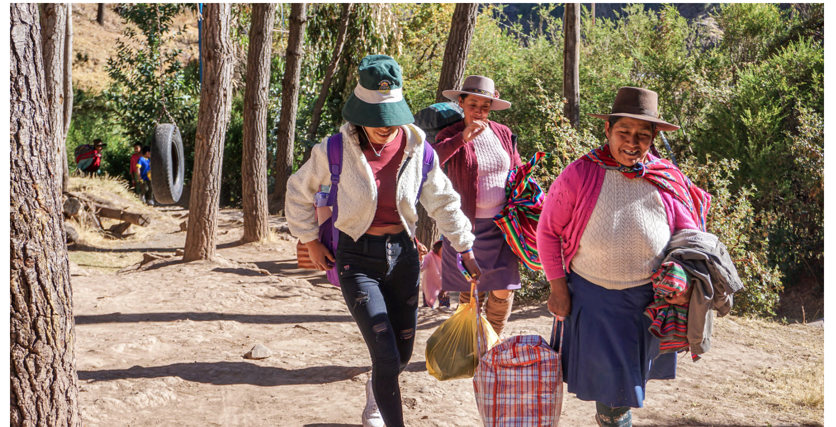
El Ayni (reciprocidad Quechua) se ve a lo largo de todo el programa. Por ejemplo, al iniciar el Programa Plan de Vida, los padres y madres de familia aportan algunos alimentos cosechados de sus chacras para la alimentación de los/as 30 jóvenes y equipo.