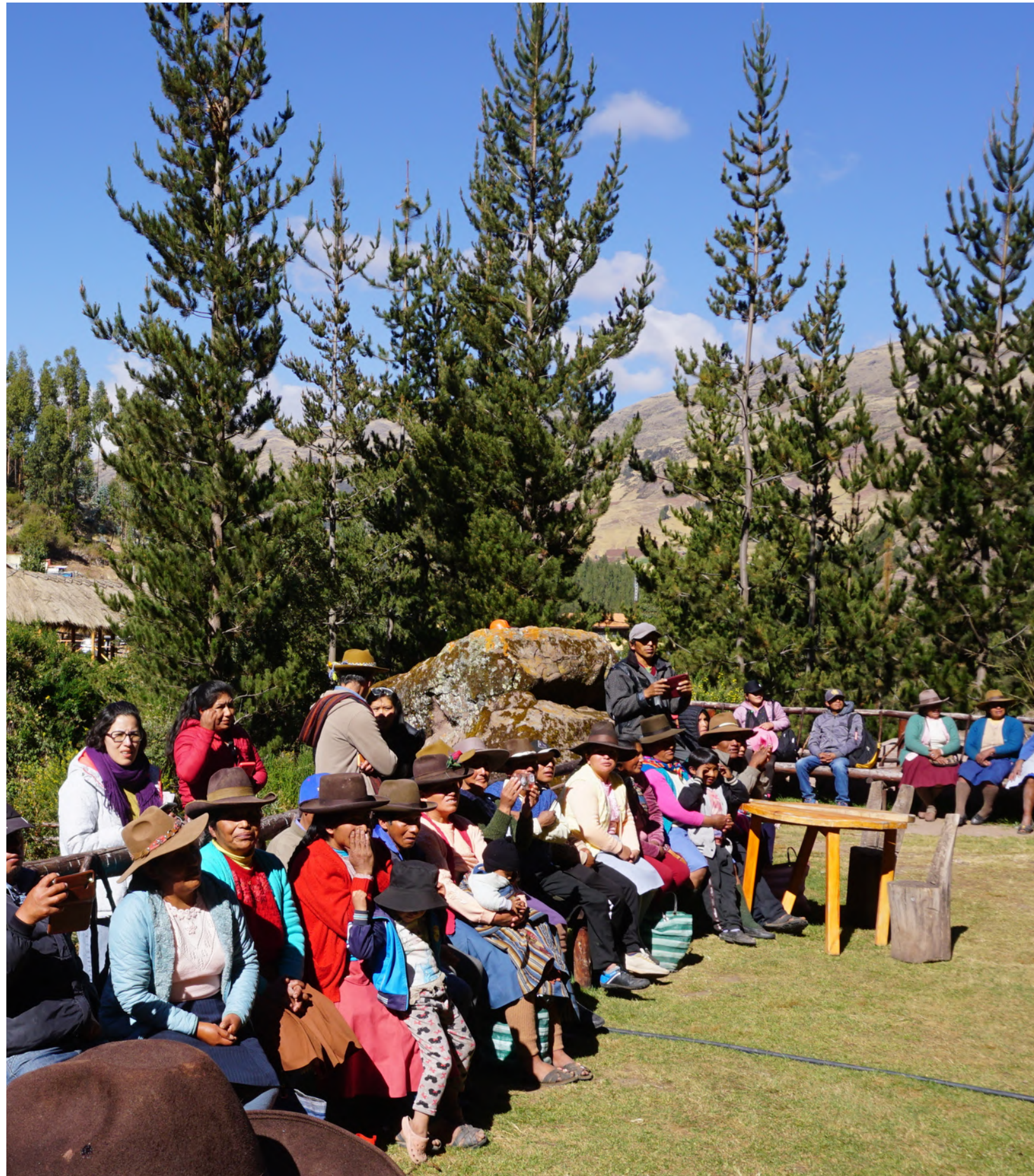
Los padres y madres de familia forman una parte fundamental del Programa Plan de Vida. Durante la Fase 1, además de visitarlos/as los domingos en el campus, asisten a la clausura para conocer más acerca de lo aprendido durante los 17 días de talleres,