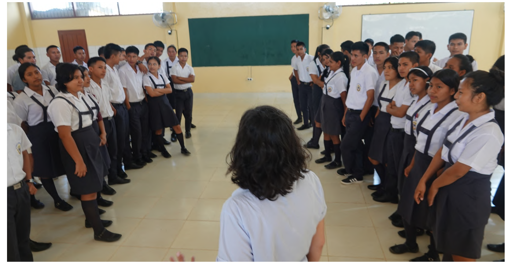
Los talleres de Plan de Vida incluyen un gran foco en la educación sexual integral y la planificación familiar preventiva.