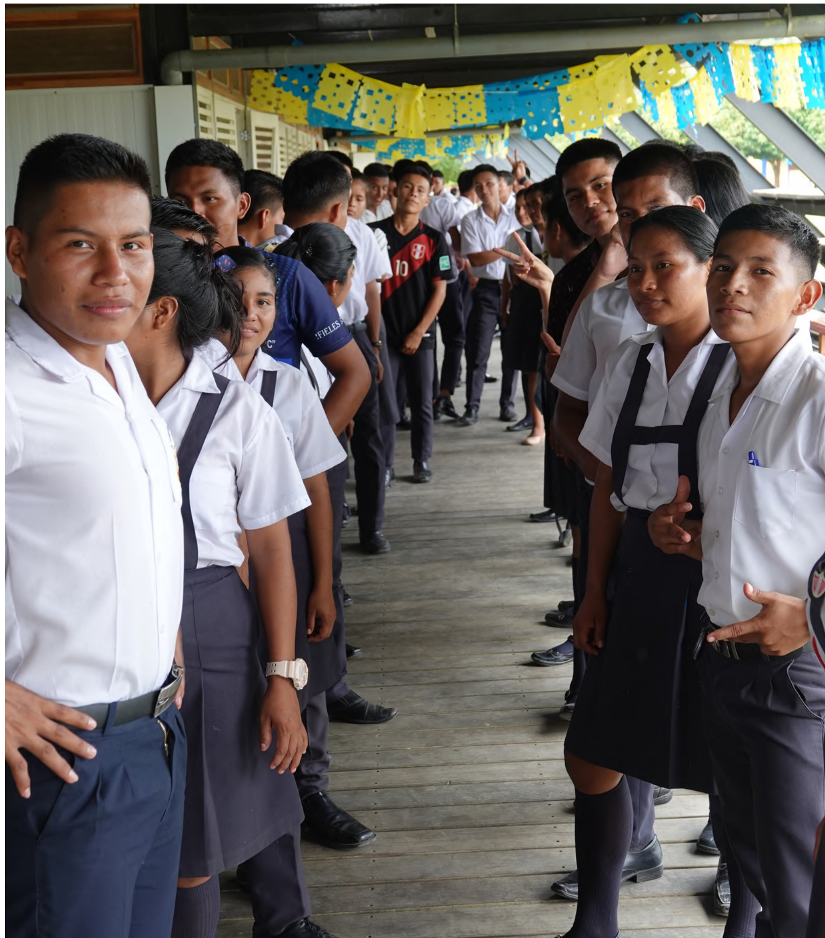
Trabajamos de la mano del Colegio Lucille Gagne Pellerin para apoyar a todos/as los/as jóvenes que quieran formar parte del Programa Plan de Vida.